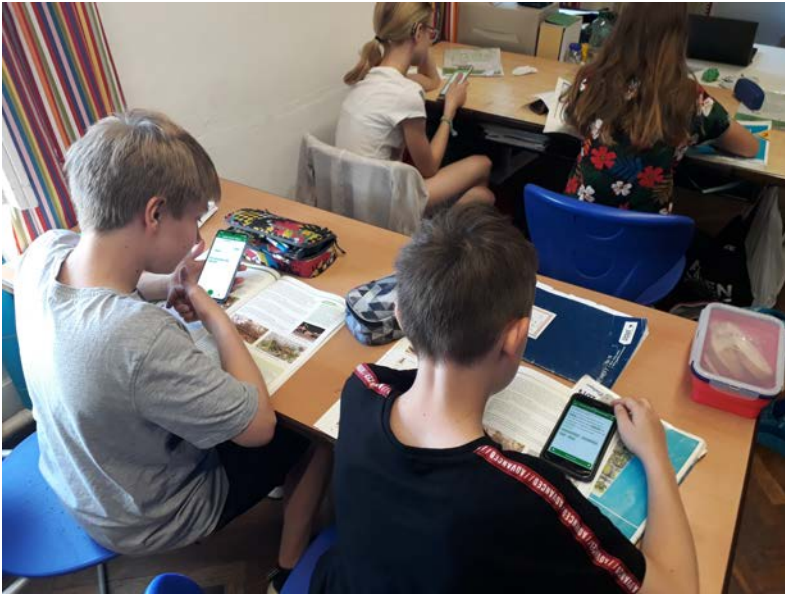
SchülerInnen lernen mit eSquirrel im Klassenzimmer