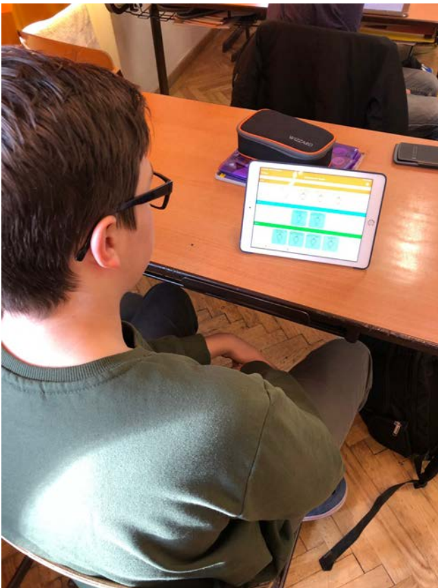
Schüler lernt mit eSquirrel am Tablet