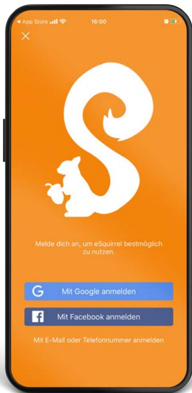
Mockup eSquirrel Login